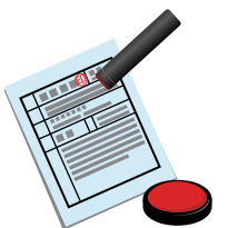
持続化給付金会場のイメージ図